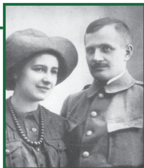
Andrzej Małkowski z żoną Olgą Drahonowską-Małkowską – założyciele harcerstwa w Polsce

* w 1919 r. „skaut” zmieniono na „harcierz”